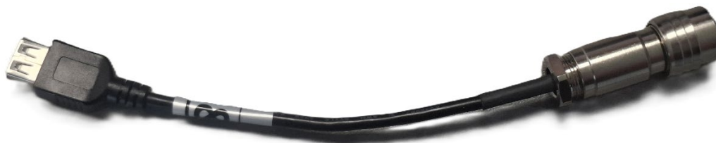
Figuur 2: Firmware-update kabel USB slangenpomp D0036672